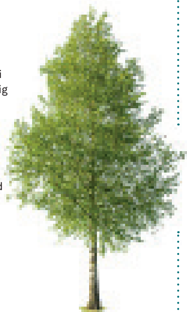
Anvisningarna är antagna av Poseidons VD 2010.