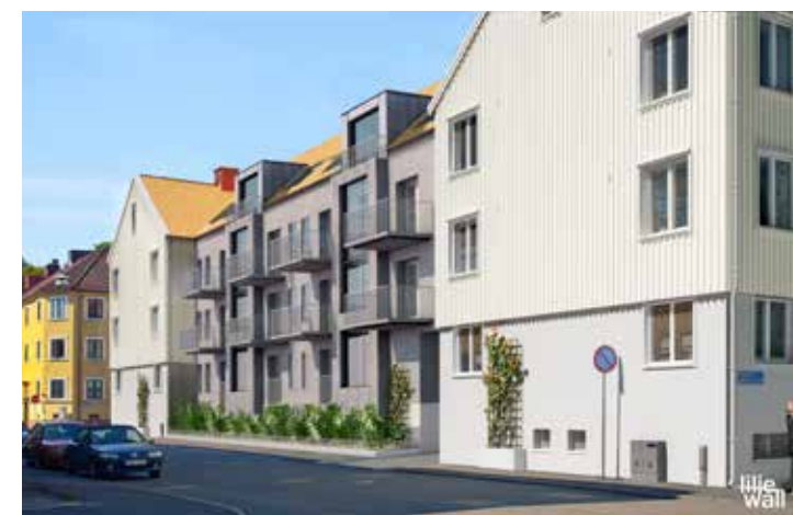
Det nya huset som binder hop två befintliga hus får 16 lägenheter som beräknas vara inflyttningsklara vid årsskiftet 2019/2020.