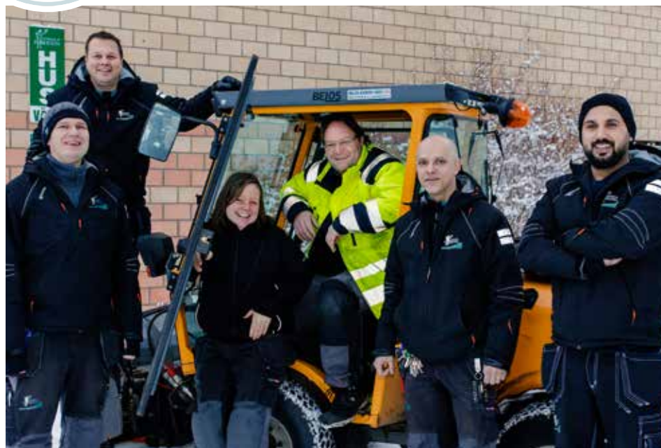
Många fler än tidigare av våra hyresgäster är nöjda med kontakten med Poseidons personal. Det gläder oss husvärdar och miljövärdar som jobbar i området!