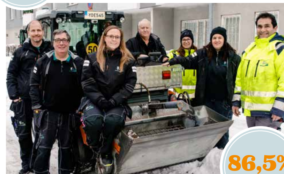
Många fler än tidigare av våra hyresgäster är nöjda med kontakten med Poseidons personal. Det gläder oss husvärdar och miljövärdar som jobbar i området!

i Jättesten är nöjda med valet av blommor och buskar i området.