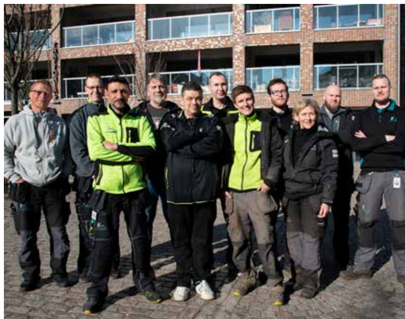
Våra hyresgäster i Gamlestad är nöjda med kontakten med Poseidons personal. Det gläder oss husvärdar och miljövärdar som jobbar i området!