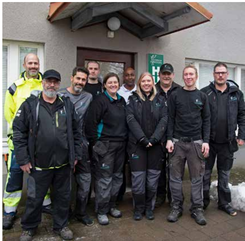
Många fler än tidigare av våra hyresgäster i Kortedala är nöjda med kontakten med Poseidons personal. Det gläder oss husvärdar och miljövärdar som jobbar i området!