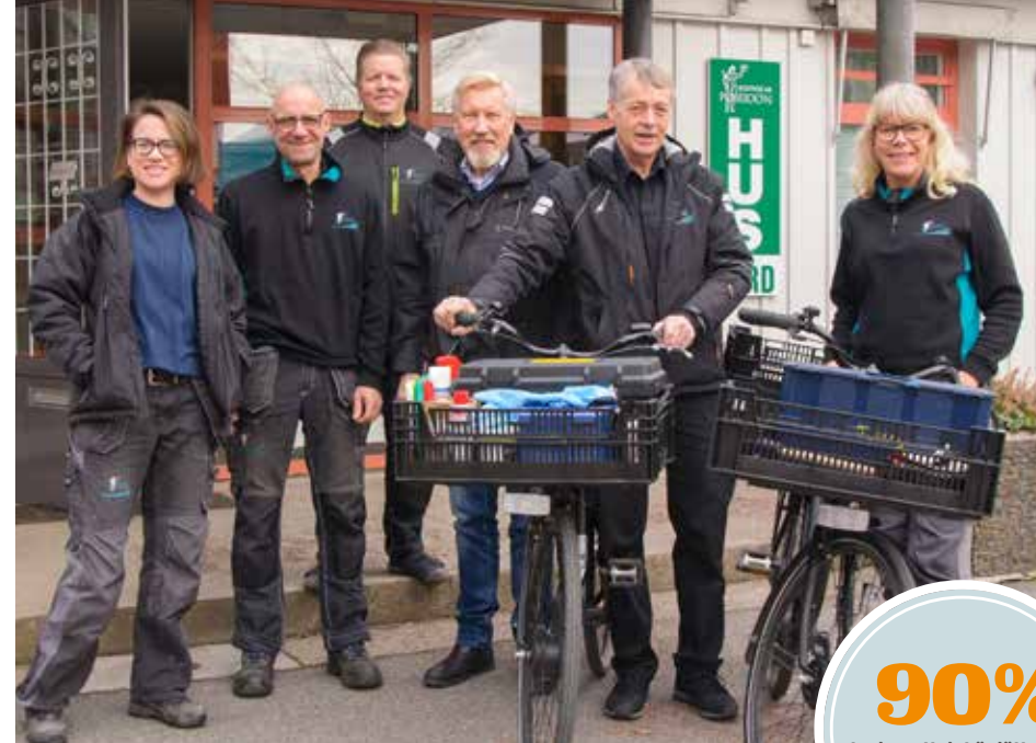
Våra hyresgäster i Backa är nöjda med kontakten med Poseidons personal. Det gläder oss husvärdar och miljövärdar som jobbar i området!