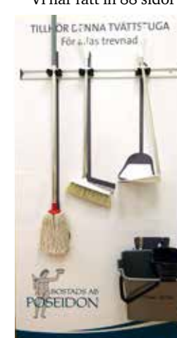
Med den här skylten blir det lättare att hålla rent och städa efter sitt pass i tvättstugan.

Vi har fått in 88 sidor med kommentarer i undersökningen och de visar bland annat att det finns ett missnöje med att grannar parkerar sina bilar inne i området, trots att det ska vara bilfritt. I samarbete med räddningstjänsten har Poseidon nu bytt ut alla bomnycklar. Det går att låna bomnyckel av husvärden vid behov.