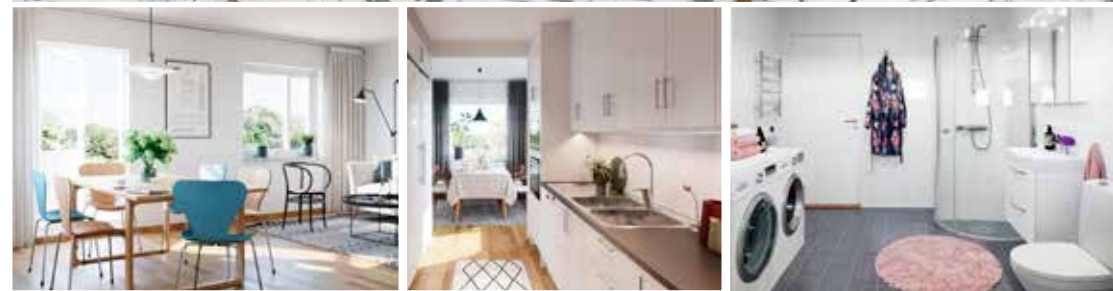
De nya radhusen och punkthusen vid Wadköpingsgatan i Backa Röd är klara för inflyttning i september. Interiörbilderna visar radhusen invändigt.