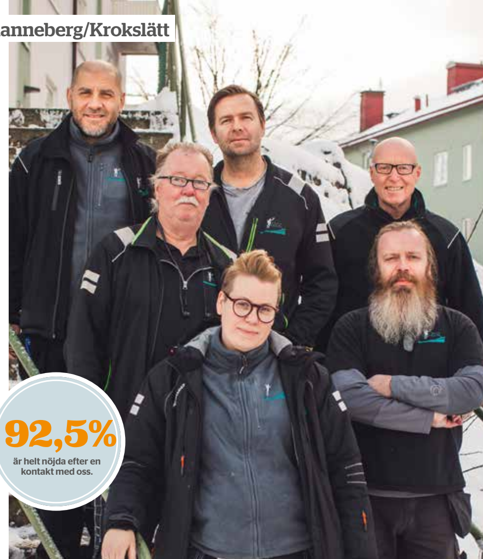
I Guldheden, Krokslätt och Johanneberg tycker våra hyresgäster bland annat att det går bra att komma fram på telefon och är nöjda med bemötandet vid felanmälan. Det gläder oss husvärdar som jobbar i området!

92,5% är helt nöjda efter en kontakt med oss.