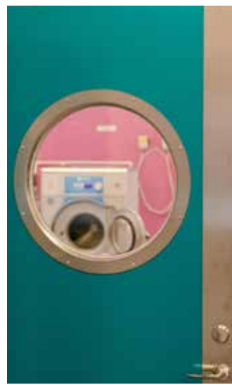
Tvättstugorna på Länkarvsgatan har fått nya, klara färger.